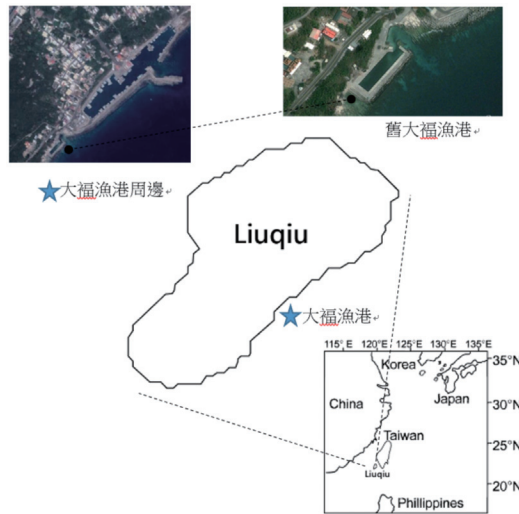
圖一 小琉球大福漁港及舊大福漁港位置示意圖

本研究以當地之漁港管理者、漁民、經營潛水或民宿之海洋休閒業者為主要 3 群組的利益相關者群組。各群組取 10 人做為代表，原漁港管理者為屏東縣政府，漁港廢止後現在實質管理者以當地漁會為主，發放問卷之管理者群者為小琉球區漁會及屏東縣政府人員為對象。漁民群組由當地一支釣與底延繩釣小型湖船的船長或船主，住所靠近舊大福漁港。海洋休閒業者群組為靠近舊大